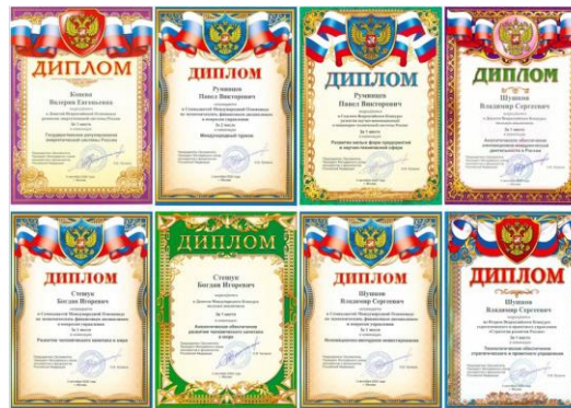
Победители конкурсов Молодежного союза экономистов и финансистов РФ