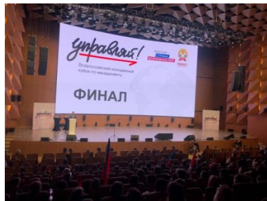
Победители Всероссийского молодежного Кубка по менеджменту «Управляй!»