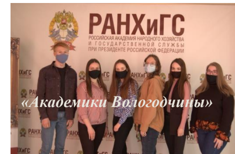
Всероссийский чемпионат по финансовой грамотности