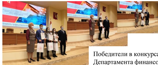
Победители в конкурсах Департамента финансов