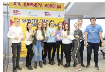
Традиционный «День 1С Карьеры» компании «Логасофт»