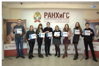
Призеры Всероссийского диктанта по английскому языку