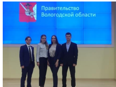
Победители ежегодного областного конкурса научных проектов «Моя стратегия – моё будущее»